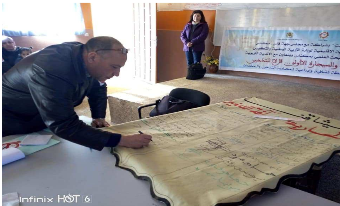
توقيع ميثاق محاربة التدخين بالمؤسسة التعليمية الثانوية الإعدادية ابن طفيل بمكناس .