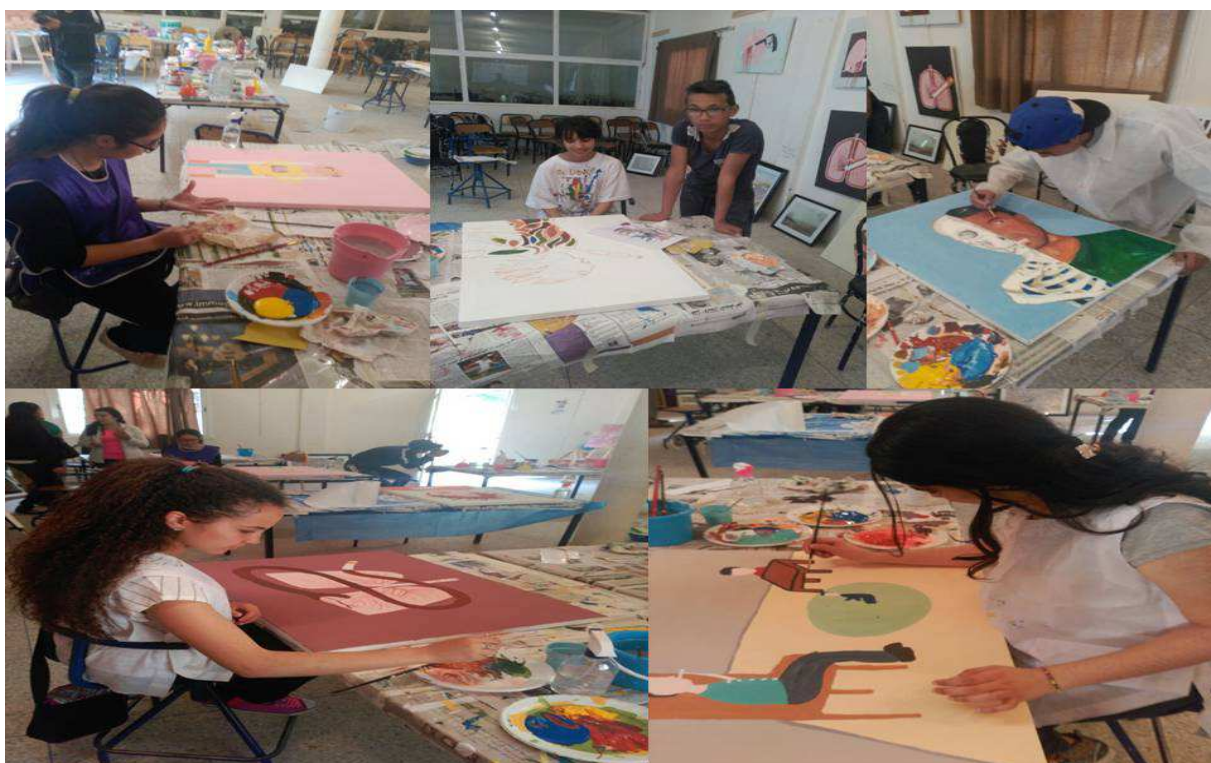
التلاميذ يضعون لمساتهم الفنية و الإبداعية على لوحاتهم حول الظاهرة