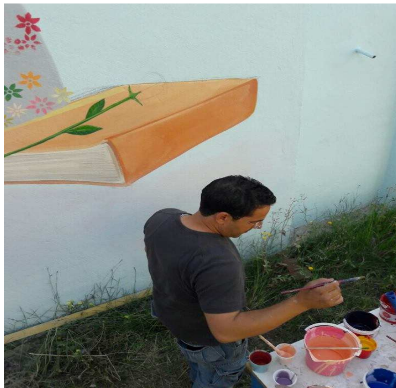
الأستاذ و الفنان نور الدين الغمري