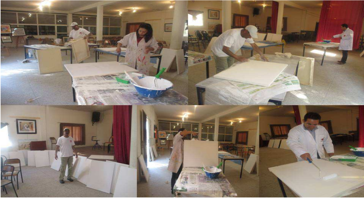
أثناء عملية تنمة صباغة اللوحات لتكون جاهزة للرسم