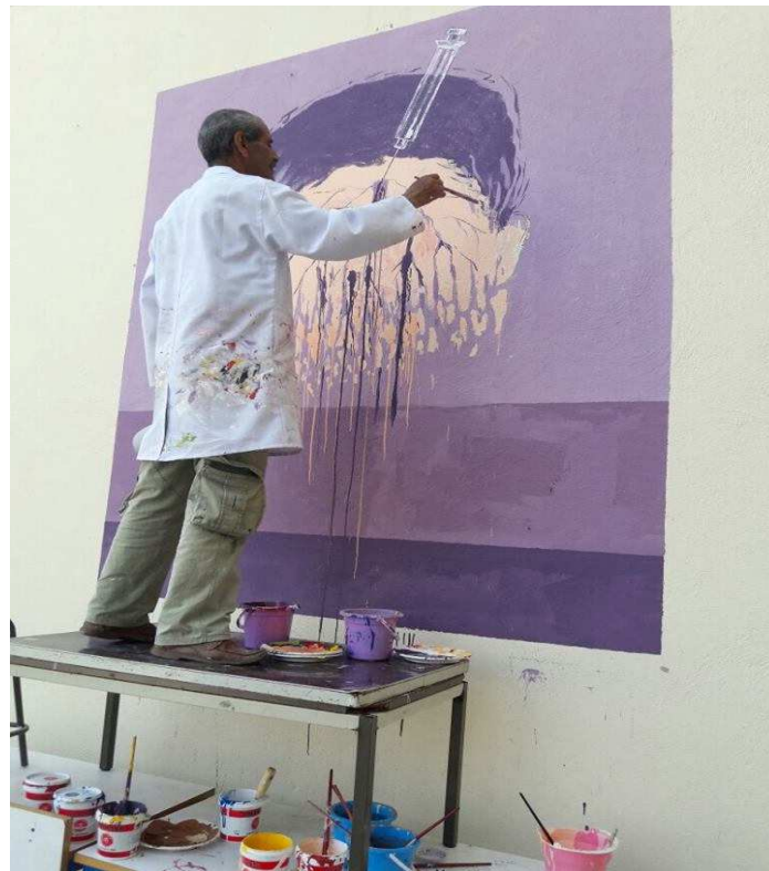
الأستاذ و الفنان اليماني يماني