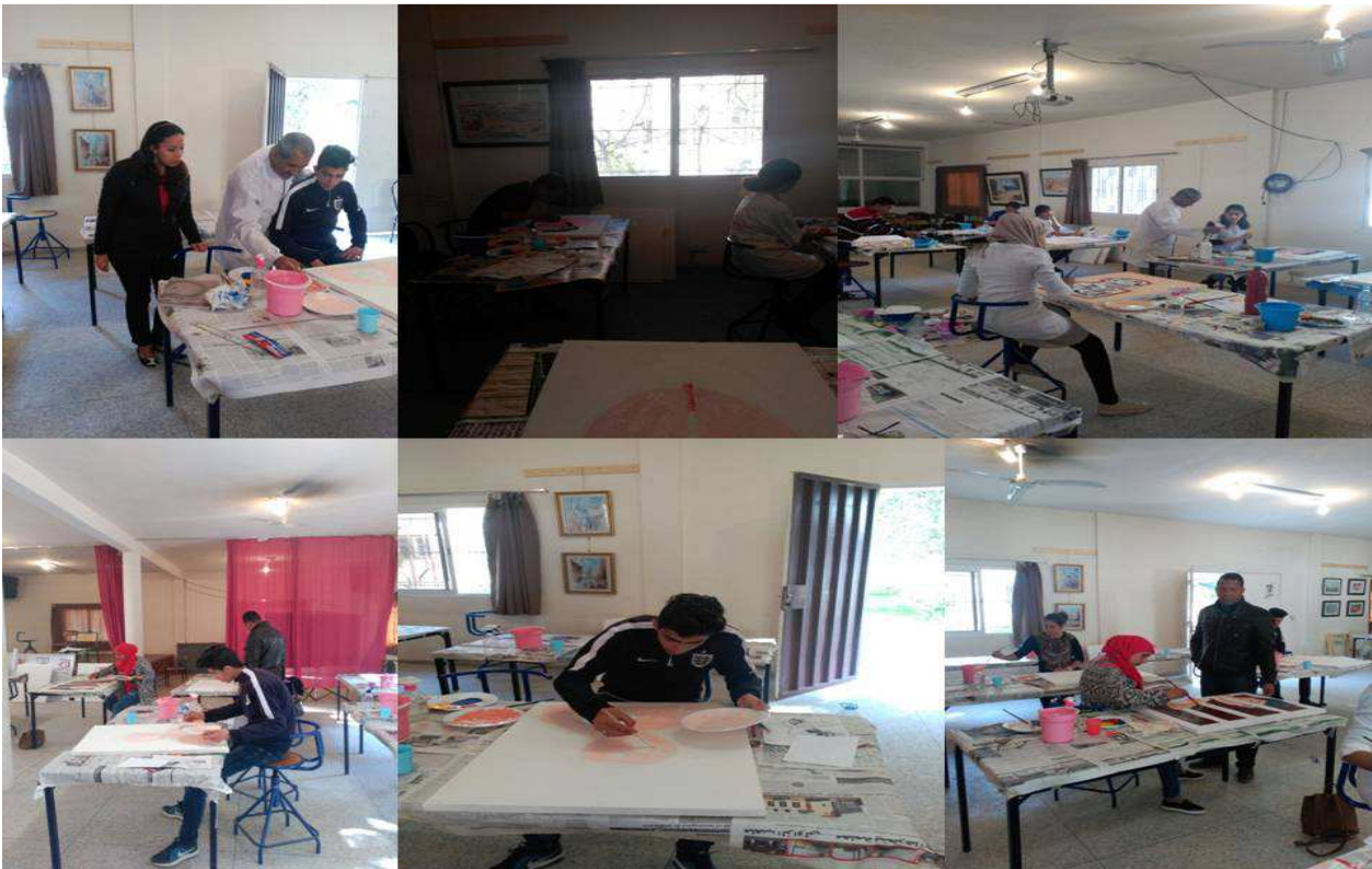
انخراط براعم ثانوية يوسف ابن تاشفين في ورشة الرسم و التعبير حول الظاهرة