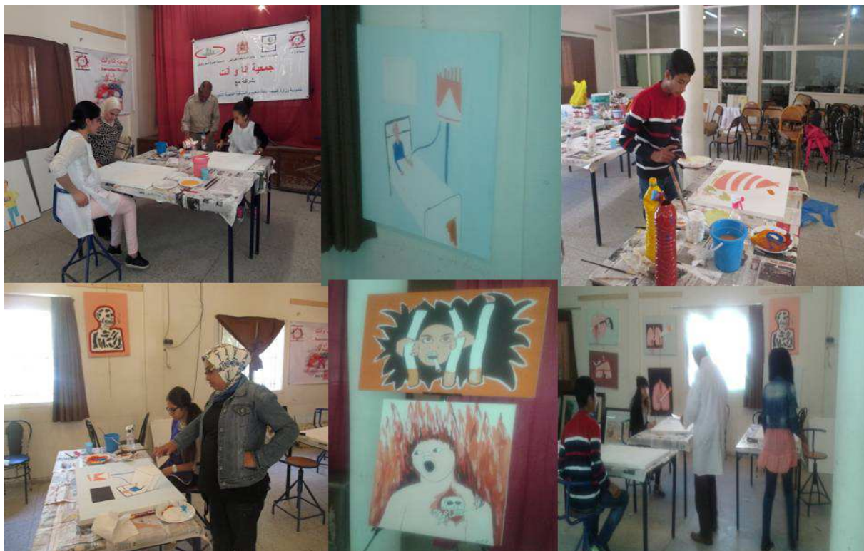
أولى لوحات التلاميذ حول ظاهرة التدخين و تعاطي المخدرات