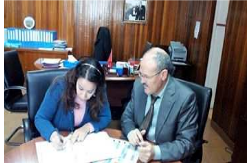
لحظة توقيع اتفاقية إطار للشراكة بين مندوبية وزارة الصحة بفاس و جمعية "أنا و أنت" صورة مع المدير الإقليمي للمديرية الإقليمية لوزارة التربية الوطنية و التكوين المهني بفاس