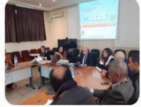
...المقاربة الثقافية والإبداعية والتكنولوجية novembre 20, 2020