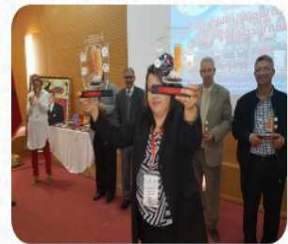
...جمعية أنا و أنت وترويج الأندية التربوية