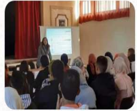
...حملة تحسيسية بالثانوية التأهيلية décembre 26, 2020