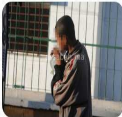
المخدرات... "عول" يترص بالمراهقين