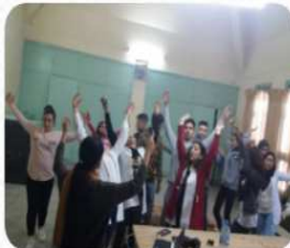
...ورشة الموسيقى بإعدادية قاطعة décembre 20, 2020