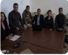
...أول تطبيق ويب لحساب décembre 20, 2020