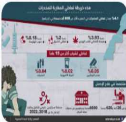
هذه خريطة تعاطي المخدرات للمغرب