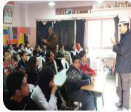
...حملة تحسيسية بالثانوية الإعدادية décembre 26, 2020