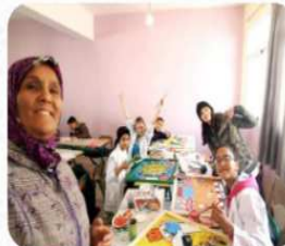
...ورشة الرسم بإعدادية عبد décembre 20, 2020