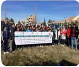
...حملة تحسيسية بالثانوية الإعدادية décembre 27, 2020