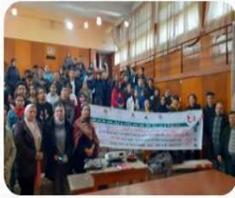
...حملة تحسيسية بالثانوية التأهيلية décembre 26, 2020