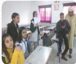
...ورشة المسرح بتانوية ابن décembre 20, 2020