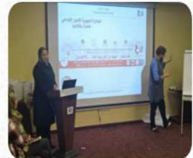
...جمعية أنا وأنت و المركز novembre 20, 2020