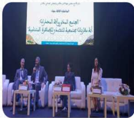
...مشاركة جمعية أنا و أنت في أشغال