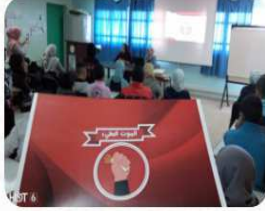
...ورشة التكنولوجيا بإعادة المغرب décembre 20, 2020