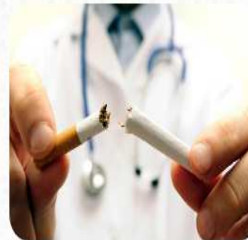
..تقرير دولي: التدخين يفتك بصحة أكثر من 17 ألف مغربي