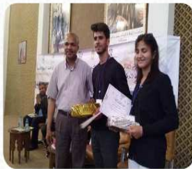
...جمعية أنا و أنت وترويج الأندية التربوية