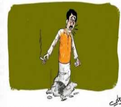
ضعف تطبيق قانون محاربة التدخين .. «لوبي التبغ» في تقصص..