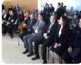
...الموت البطيء: أول تطبيق décembre 19, 2020